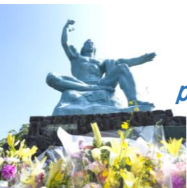
平和のシンボル 「平和祈念像」/平和公園