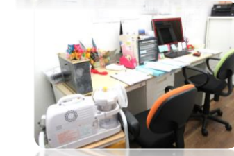
野の花ケアステーション成田