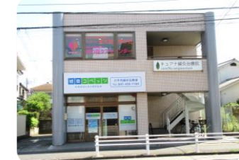
野の花ケアステーション八千代

八千代市・佐倉市・四街道市・千葉市・成田市にお住まいの方を対象にした信頼性の高い訪問介護サービスを提供しています。