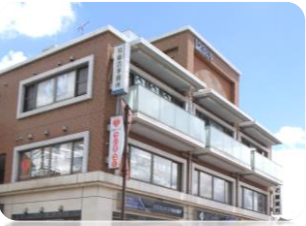
野の花ケアステーション