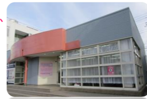
白ゆり訪問看護ステーション