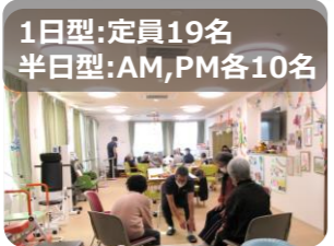
1日型:定員19名 半日型:AM,PM各10名