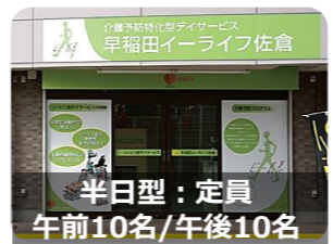
半日型：定員 午前10名/午後10名